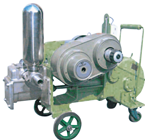
←ステンレス製無段変速機付

自動搾り機に最初高速で、圧が高くなると低速で送ります。(変速機付のみ) ボールバルブで夾雑物も平気です。バルブはワンタッチで分解清掃できます。 ステンレス製ですから半永久的に使用できます。 独特のギヤー機構ですから音が大変静かです。