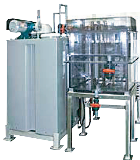
αトリノ type-2 連続製造能力:300L/h