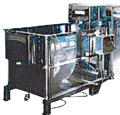
バクテリアブレイカー 5X 攪拌槽容量:500L