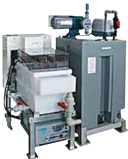
αトリノ type-1 連続製造能力:100L/h

αトリノ水生成システムは、水と食塩から中性電解水を製造します。 従来の電解水や次亜塩素に比べ殺菌効果が高く、塩素臭がありません。