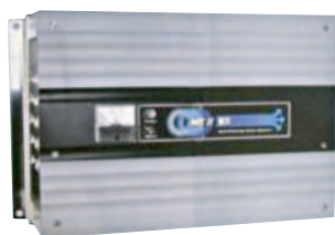
MK II DX

マイナス帯電生成装置は、コイルに流れる微弱の電流により、表面電位を中位もしくはマイナス(-)に帯電させ管壁等へのスケール付着を防止します。 また「黒錆」を生成し、保護皮膜によって鋼材の防食が可能になります。「流す水から洗う水」への特質も持ち、油汚れの流下・悪臭の防止等に優れた効果を発揮します。