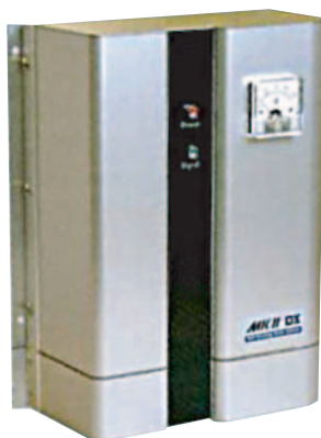
MK II EX