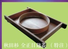
秋田杉 全正目麹 (特注)