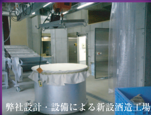
弊社設計・設備による新設酒造工場