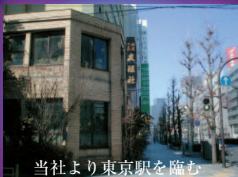
当社より東京駅を臨む